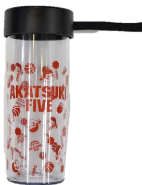
◇アイテム詳細 ITEM：クリアストラップボトル PRICE：¥1,500 (tax in)