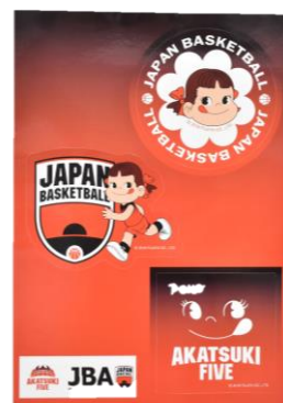
◇アイテム詳細 ITEM：ステッカー PRICE：¥500 (tax in)