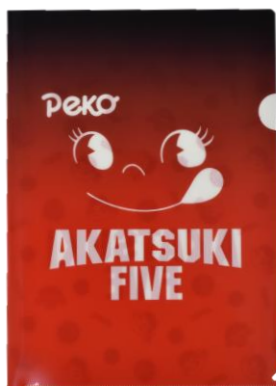
◇アイテム詳細 ITEM：クリアファイル PRICE：¥500 (tax in)

有限会社レインボーワークスでは、プロパティを旬な時期に親和性のあるブランドと販路を結び付け商品企画を展開していくことでライセンスの良さを最大限に生かし、認知浸透・販路拡大に繋げています。