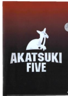
◇アイテム詳細 ITEM：クリアファイル PRICE：¥500 (tax in)

有限会社レインボーワークスでは、プロパティを旬な時期に親和性のあるブランドと販路を結び付け商品企画を展開していくことでライセンスの良さを最大限に生かし、認知浸透・販路拡大に繋げています。