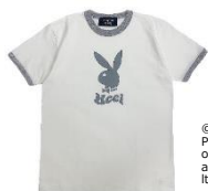
© 2023 Playboy Enterprises International, Inc. Playboy and the Rabbit Head Design are trademarks of Playboy Enterprises International, Inc. and used under license by RAINBOWWORKS Co., Ltd.

有限会社レインボーワークスでは、自社のプロパティを旬な時期に親和性のあるブランドと販路を結び付け商品企画を展開していくことでライセンスの良さを最大限に生かし、認知浸透・販路拡大につなげています。