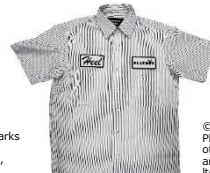
© 2023 Playboy Enterprises International, Inc. Playboy and the Rabbit Head Design are trademarks of Playboy Enterprises International, Inc. and used under license by RAINBOWWORKS Co., Ltd.

ITEM : RABBIT MOTIF TEE PRICE : ¥ 6,600 (税込) COLOR : WHITE SIZE : M / L / XL