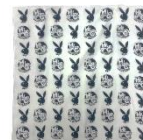
© 2023 Playboy Enterprises International, Inc. Playboy and the Rabbit Head Design are trademarks of Playboy Enterprises International, Inc. and used under license by RAINBOWWORKS Co., Ltd.

ITEM : BANDANA PRICE : ¥ 3,850 (税込) COLOR : WHITE SIZE : F