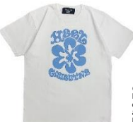
© 2023 Playboy Enterprises International, Inc. Playboy and the Rabbit Head Design are trademarks of Playboy Enterprises International, Inc. and used under license by RAINBOWWORKS Co., Ltd.

ITEM : RABBIT MOTIF RINGERTEE PRICE : ¥ 6,600 (税込) COLOR : WHITE x GREY / WHITE x BROWN SIZE : M / L / XL