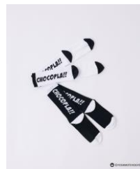
ITEM : 2Pソックス PRICE : ¥2,420 (tax in) COLOR : WHITE / BLACK SIZE : ONE SIZE