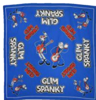
◇アイテム詳細 ITEM：バンダナ PRICE：¥1,000(tax in) COLOR：BLUE SIZE：F