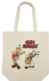
◇アイテム詳細 ITEM：トートバッグ PRICE：¥2,900(tax in)