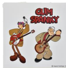
◇アイテム詳細 ITEM：ステッカー PRICE：¥600(tax in)