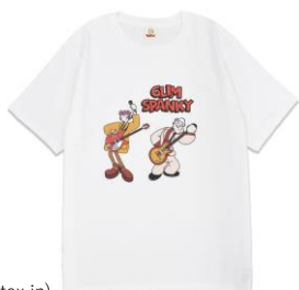
◇アイテム詳細 ITEM：Tシャツ PRICE：¥3,800(tax in) COLOR：WHITE / BLACK

有限会社レインボーワークスでは、プロパティを旬な時期に親和性のあるブランドと販路を結び付け商品企画を展開していくことでライセンスの良さを最大限に生かし、認知浸透・販路拡大に繋げています。