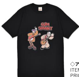
◇アイテム詳細 ITEM：スウェット PRICE：¥6,000(tax in) COLOR：WHITE / BLACK