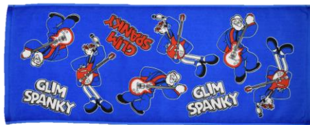
◇アイテム詳細 ITEM：フェイスタオル PRICE：¥2,500(tax in) COLOR：BLUE SIZE：F